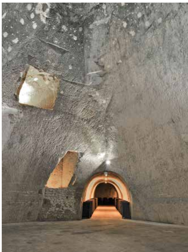
Plate of the Pommery cellars

Con 50 m de altura, las de Ruinart son las más altas. La temperatura, constante, oscila entre 10 y 12°C y se han contado 20 km de bodegas debajo de las laderas históricas, 57 km y cerca de 350 zarcas para la colina Saint Nicaise y 74 km en Epernay.