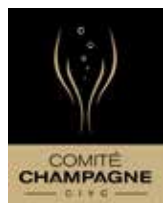
Logo of the Comité Champagne