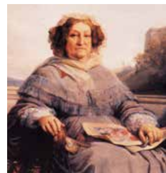
Portraits of Madame Pommery and Madame Clicquot- Ponsardin