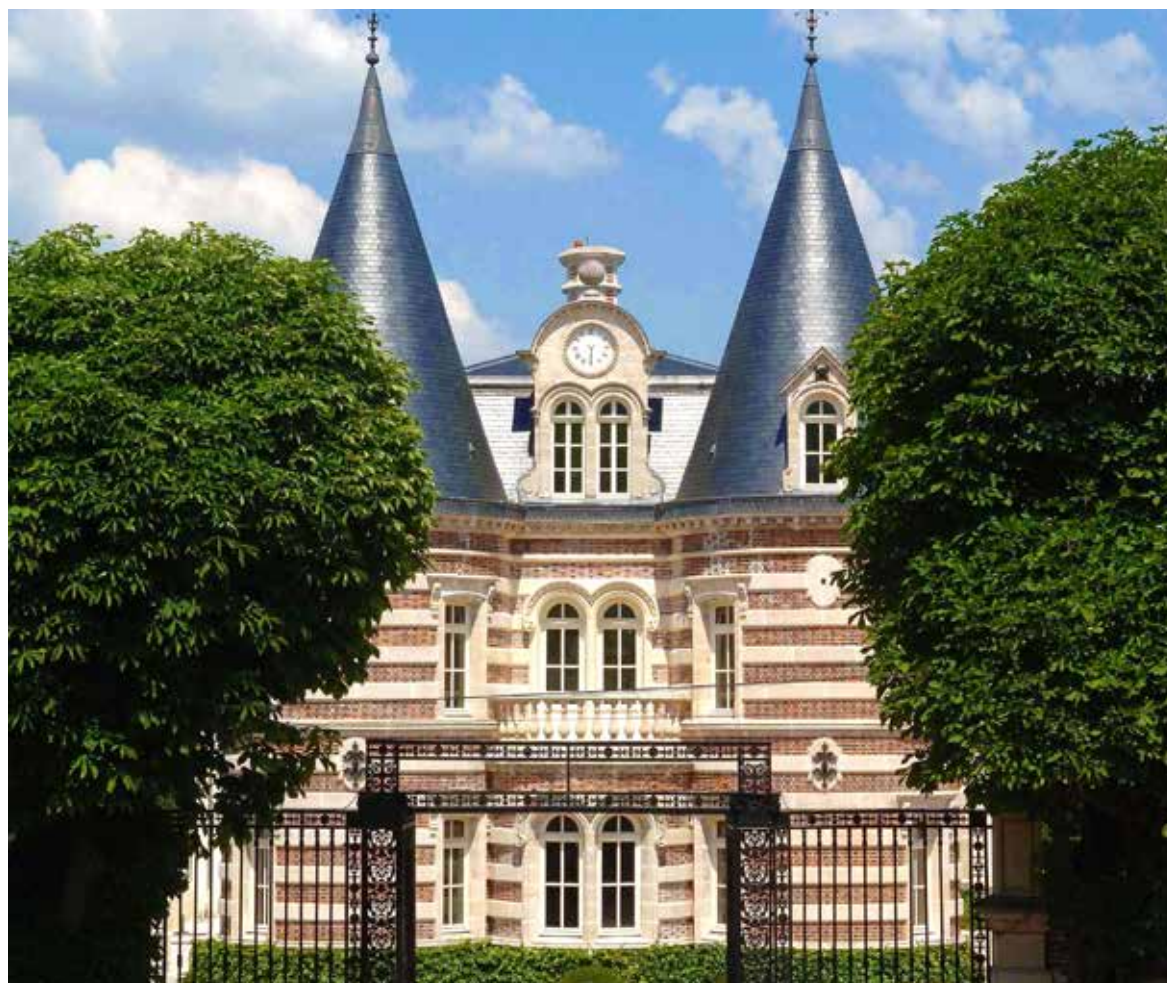
Pékin Castel, Avenue de Champagne, Epernay

dinaria (la isla de Pico en las Azores) o por su carácter histórico (la Costa de Tokaj en Hungría, Saint-Emilion en Francia). El valor excepcional de las « Laderas, Casas y Bodegas de Champaña » se materializa de una manera muy diferente con respecto a estos paisajes. La Champaña, modelada por su agitada historia y su posición geográfica, es también una tierra donde el hombre ha sabido dar forma a un patrimonio único (rural, urbano y subterráneo) en la creta y extraer de una tierra ingrata un néctar apreciado en el mundo entero. La inscripción de las « Laderas, Casas y Bodegas de Champaña » es un reconocimiento para este patrimonio único y para el saber hacer de los hombres que ha permitido al método de elaboración del champaña volverse una referencia, así como una incitación a continuar los esfuerzos para preservar y valorizar los paisajes vitícolas.