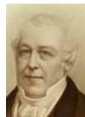
Portrait of Jean-Rémy Moët (1758-1840)

En los siglos XVIII y XIX, el comercio del Champaña atrae y suscita el interés de nuestros vecinos alemanes. Las grandes Casas de Champaña a menudo surgen de historias franco-alemanas , a semejanza de la Casa Veuve Clicquot, de la Casa Krug o también Bollinger. La mayoría de las veces son jóvenes alemanes, motivados y creativos, que vienen a Champaña a formarse e integrarse, y que terminan por asociarse o crear su propia Casa.