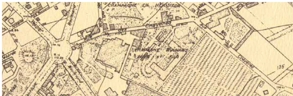
Map of the Saint-Nicaise Hill 1948