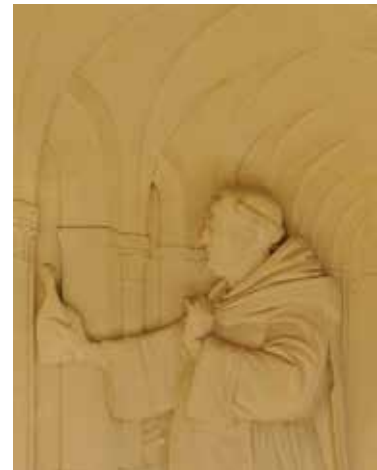
Bas-relief de dom Pierre Pérignon

Yace en el coro de la iglesia abacial Saint-Sindulphe en Hautvillers desde 1715.