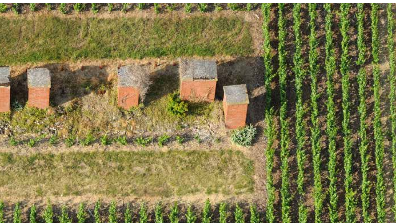
Vent stacks marking the presence of cellars, Aÿ

Su modo de producción particular, que incluye especialmente una segunda fermentación en botella, ha generado toda una organización de la actividad y del espacio, con un desarrollo excepcional de bodegas (aproximadamente 370 galerías excavadas de creta debajo de la colina Saint-Nicaise en Reims, 110 km de bodegas debajo de la avenue de Champagne en Epernay, y 10 km debajo de las laderas históricas). Un paisaje subterráneo excepcional que constituye uno de los ejemplos mundiales más representativos del patrimonio industrial vitivinícola, aún en explotación hoy en día.