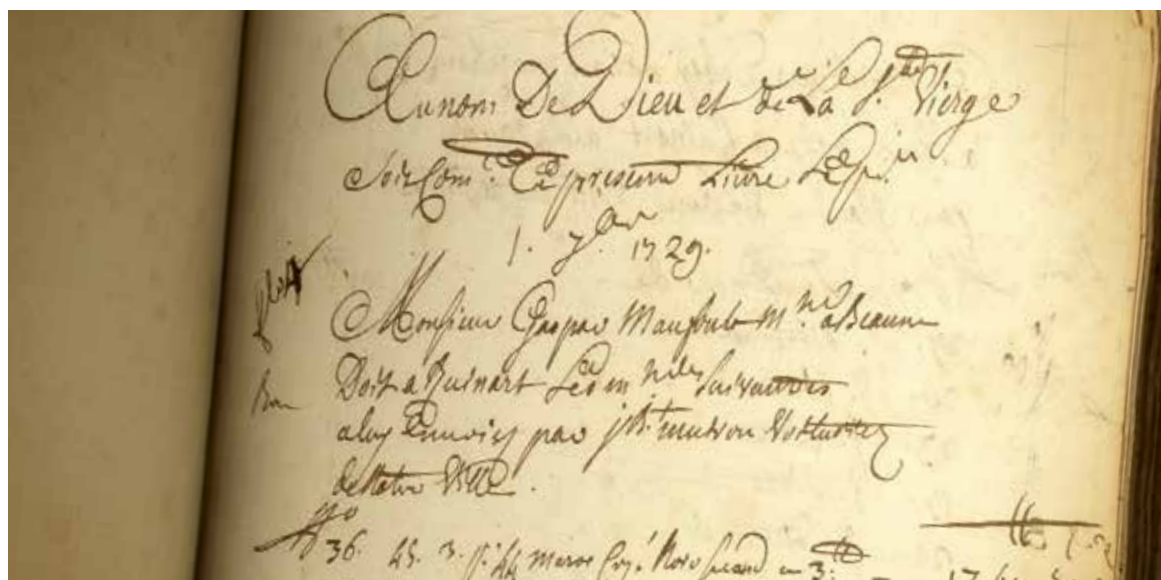
First book of accounts dedicated to Champagne wine of Nicolas Ruinart, 1729