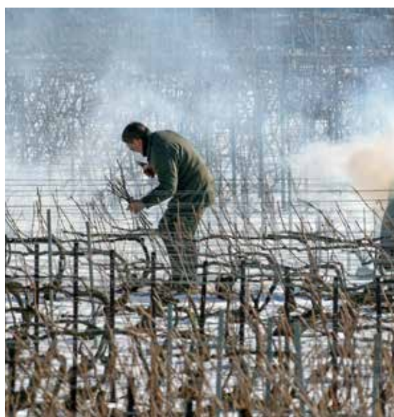
Man's savoir-faire : pruning

Estos tres elementos constitutivos del Bien inscrito encarnan la región del Champaña y combinan las funciones de entorno de vida, entorno de trabajo y vitrina de un saber hacer tradicional. Son el lugar de creación del método de referencia de la vinificación efervescente. El Champaña, producto de excelencia, es reconocido como el símbolo universal de la fiesta, la celebración y la reconciliación.