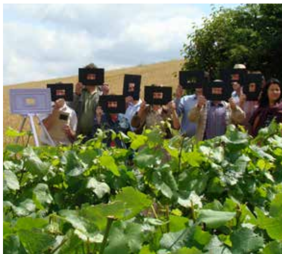
Saint-Vincent Celebrations 2014 displaying the colors of the candidacy

Las acciones realizadas dirigidas a los niños siempre son muy apreciadas. Los jóvenes se asociaron varias veces durante el año, mediante concursos de creatividad, soportes de edición lúdicos o incluso liberaciones de globos.