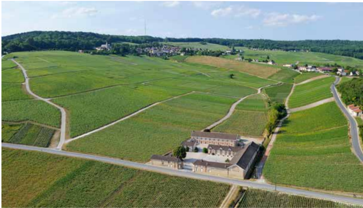
Sainte-Hélène, wine-making facility, Hautvillers

Toda candidatura al patrimonio mundial exige la definición y la delimitación de un perímetro del Bien propuesto para inscripción. Se trata de un ejercicio que impone un gran número de elecciones, en función de criterios exigentes, que garanticen el Valor Universal Excepcional de las Laderas, Casas y Bodegas de Champaña. Por esto, en el corazón del área de producción de la DOC Champaña, situada en los departamentos de Marne, Aube, Aisne, Haute-Marne y Seine-et-Marne, el Bien seleccionado realiza la síntesis entre los lugares de abastecimiento, ahí donde nace y madura la uva, los lugares de elaboración, ahí donde se ensambla y madura el vino, y los lugares de comercialización, ahí donde el Champaña se expone y sale al mundo. El Bien inscrito consta tres conjuntos representativos - las laderas históricas, la colina Saint-Nicaise y la avenue de Champagne - situados en el Departamento de Marne, en la Región Champaña-Ardenas y que se extienden sobre una superficie de 1 100 hectáreas. Se ha definido una zona de « amortiguamiento », de vigilancia, alrededor de cada uno de los tres sitios para favorecer su conservación. Una zona de compromiso también forma parte del perímetro del Bien inscrito, con la finalidad de preservar los paisajes y patrimonios del Champaña. Una zona que reúne a los 320 municipios del área de producción DOC Champaña.